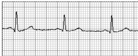
aVL N 25mm/s 32Hz