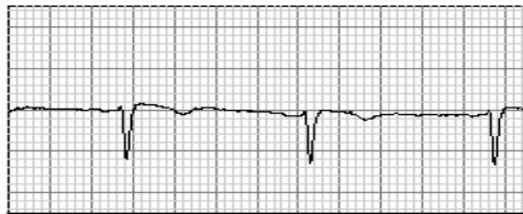
V1 N 25mm/s 32Hz ST=0,04 mm