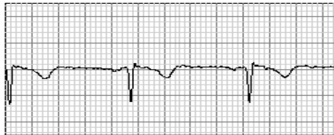
aVR N 25mm/s 32Hz