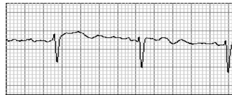
V3 N 25mm/s 32Hz